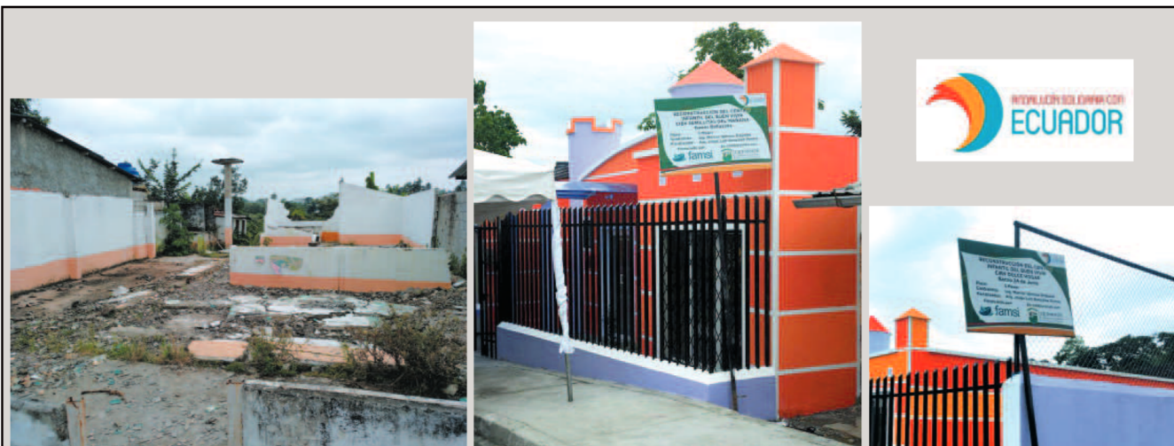
A la izquierda: aspecto del Centro Infantil Semillitas del Mañana, destruido por el terremoto de magnitud 7,8 ocurrido en 2016. En una situación similar quedó el Centro Infantil Dulce Hogar. Ambos en el cantón de Quinindé, han sido reconstruidos y puestos de nuevo en funcionamiento gracias