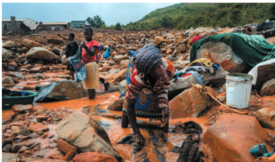
Todas la imágenes de esta noticia son de internet y su calidad puede variar