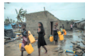
Agua potable para Mozambique Pág 3