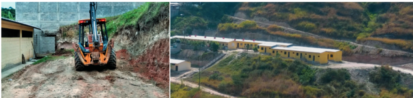
Se produjo un deslave de lodo sobre las viviendas construidas y habitadas por mujeres en riesgo de exclusión social y sus familias