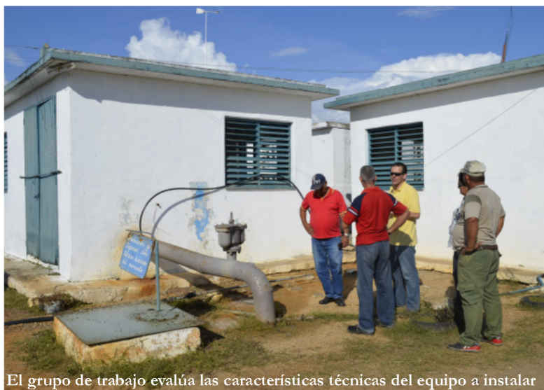
El grupo de trabajo evalúa las características técnicas del equipo a instalar

En el marco de una campaña promovida por Naciones Unidas, el Fondo Andaluz de Municipios para la Solidaridad Internacional , FAMSI, a propuesta de las autoridades cubanas, inició acciones para informar y sensibilizar a sus socios animándolos a unirse en una acción coordinada, pero cada uno de forma independiente, de acuerdo con su propio presupuesto. La Diputación de Sevilla colabora, con otras entidades, favoreciendo así la movilización de recursos económicos andaluces para cubrir las necesidades de suministro y falta de agua potable en cuatro provincias del país afectadas gravemente por los diferentes huracanes que