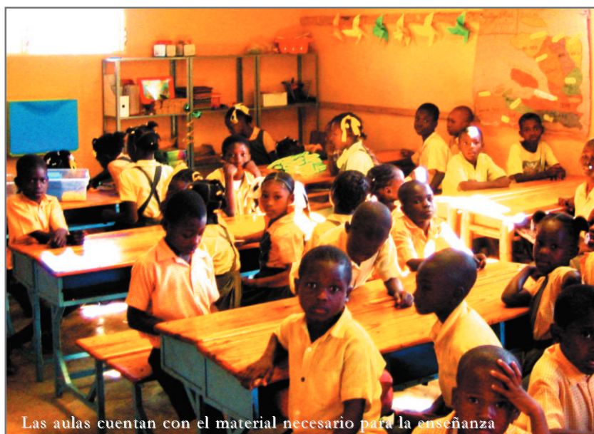
Las aulas cuentan con el material necesario para la enseñanza

Gracias a la escuela y el centro de salud, entre otros, Bois Tombé se ha convertido en un centro de servicios al público. Asisten al colegio unos 500 alumnos de 4 a 15 años desde 2013, utilizando en su mayoría el comedor escolar. Participan en el abastecimiento de alimentación al comedor y en la dotación de material escolar a las aulas los municipios sevillanos de El Cuervo , El Castillo de las Guardas , Los Molares y El Pedroso , junto con algunas ONGD. Para sus proyectos han contado con el apoyo de la Diputación de Sevilla a través de su Convocatoria de subvenciones con una financiación global de 100.000€.