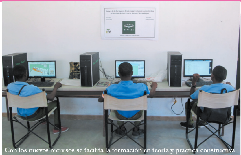
Con los nuevos recursos se facilita la formación en teoría y práctica constructiva

La asociación Acción Misionera Vivenciana de España , COVID-AMVE , y la organización mozambiqueña Asociación de la Congregación de la Misión de los Padres Vicentinos (COMPAVI) , con el apoyo de la Diputación de Sevilla , han construido en el Centro de Formación Profesional de