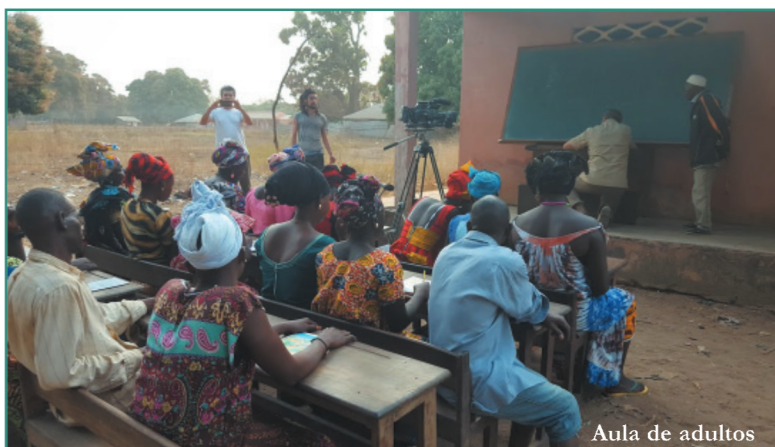
Aula de adultos

por Canal Sur, cuyos fondos fueron destinados íntegramente al proyecto. Como con África es Mujer , serie documental que está a punto de entregar a Canal Sur, compuesta por tres capítulos de 30 minutos y un largo de 70 minutos sobre la vida cotidiana de las mujeres en Guinea-Bissau.