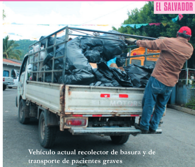
Vehículo actual recolector de basura y de transporte de pacientes graves

La Diputación de Sevilla viene manteniendo desde hace tiempo colaboración en materia de cooperación al desarrollo con El Salvador y, en particular, con esta localidad ya que al tratarse de un municipio pequeño y alejado de grandes ciudades no dispone de las necesidades básicas. Se han ejecutado tres proyectos muy importantes: la dotación de equipos de fumigación contra el dengue en viviendas; la construcción de letrinas, que son ecológicas y no causan problemas en los pozos de agua; y la compra de un minibus escolar pues, la población está muy diseminada, y los niños y niñas tenían muchas dificultades para ir a la escuela y volver a sus casas.