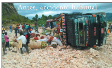
Antes, accidente habitual