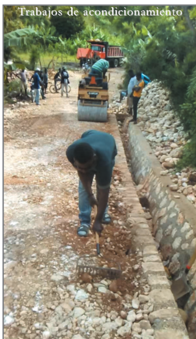
Trabajos de acondicionamiento