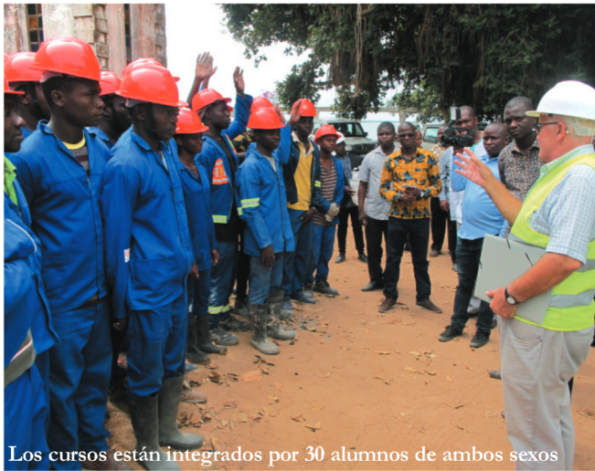
Los cursos están integrados por 30 alumnos de ambos sexos

Lumbo, adscrito al Instituto Politécnico de Nacuxa , un bloque directivo, con un módulo destinado a gestión administrativa y una biblioteca, para coordinar la acción educativa de los 64 jóvenes que reciben allí formación profesional en hostelería y turismo. A su vez se han construido cuatro salas de aulas equipadas para la implantación de una nueva cualificación profesional en Construcción Civil , con mesas de delineación básica y ordenadores con programas de diseño gráfico. El objetivo es favorecer los estudios de mejores técnicas constructivas de cimientos, canalización de aguas sucias y limpias, instalaciones eléctricas, ventanas y puertas bien ajustadas, ventilaciones y todos los aspectos necesarios para los alumnos que cursen los tres niveles para ser técnicos medios de Construcción Civil .