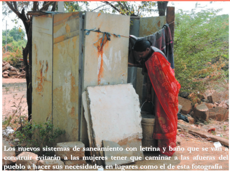
Los nuevos sistemas de saneamiento con letrina y baño que se van a construir evitarán a las mujeres tener que caminar a las afueras del pueblo a hacer sus necesidades en lugares como el de esta fotografía

La Fundación Vicente Ferrer está llevando a cabo con la colaboración de la Diputación Provincial de Sevilla en el Distrito de Anantapur, ubicado en el Estado de Andhra Pradesh, India, un proyecto con criterios de equidad de género, concebido de manera integral para hacer efectivo el derecho humano de acceso a una habitabilidad digna y al saneamiento básico. Se trata de una zona rural empobrecida donde se hayan los colectivos tradicionalmente más discriminados por el rígido sistema de castas que estructura la sociedad india, como son los dalits y las castas bajas desfavorecidas, donde se vulneran su derecho a la vivienda y al saneamiento. Se están construyendo 36 viviendas dignas en la aldea de Tadimarri, con la propiedad de las mismas predominantemente en manos de las 33 mujeres y 3 hombres