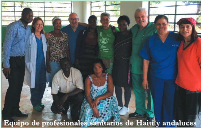
Equipo de profesionales sanitarios de Haití y andaluces