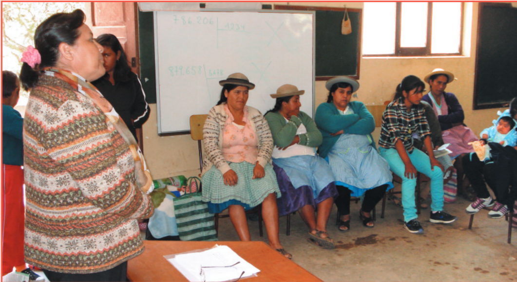
Se trabaja en talleres para concienciar de que la denuncia del maltrato y la violencia es un derecho y una apuesta por la vida, por la protección e integridad de las mujeres y sus hijos e hijas