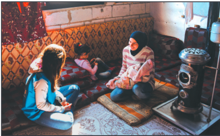
Las familias se encuentran con cada vez mayores dificultades para poner comida en la mesa y pagar alquileres, por lo que la población refugiada se va haciendo cada vez más vulnerable económicamente a medida que se prolonga su desplazamiento.