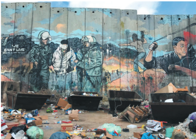
Campo de refugiados de Aida, en Belén, establecido en 1950 por la Agencia de Naciones Unidas para los Refugiados en Palestina

Esta misión permite estructurar el marco de colaboración con la Autoridad Nacional Palestina (ANP) a través de la Oficina de la Presidencia, el Ministerio de Administraciones Locales y el Ministerio para Jerusalén. Así, las autoridades palestinas y la delegación andaluza, a través de FAMSI, han acordado la firma de dos acuerdos institucionales que fijarán el marco de colaboración: un acuerdo con la Autoridad Nacional Palestina, con la Oficina de la Presidencia, y un acuerdo con los municipios de Jerusalén. Los acuerdos integrarán las líneas de colaboración, entre ellas gestión municipal, patrimonio, desarrollo local o intercambios técnicos y políticos. Se está valorando, además, la posibilidad de envío de equipamientos y dotación de vehículos (ambulancias) o acciones que permitan facilitar la educación y formación a población joven palestina.