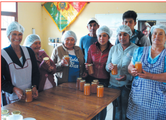
Capacitación de mujeres en la transformación de alimentos agrícolas para impulsar la independencia económica

Son 186 las personas beneficiarias directas del proyecto (150 mujeres y 21 hombres) pertenecientes a 12 comunidades rurales y 1 barrio periurbano de la ciudad de Tarija (provincia de Cercado), incluyendo a docentes, a autoridades locales y a 12 agentes sanitarios.