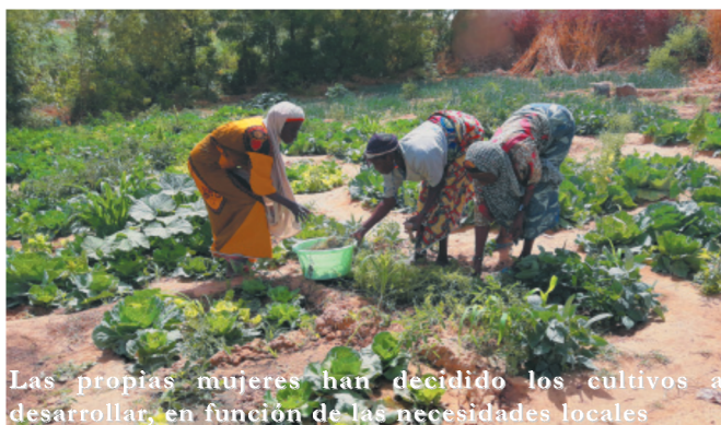
Las propias mujeres han decidido los cultivos a desarrollar, en función de las necesidades locales

Se busca el fortalecimiento de 13 asociaciones de mujeres que integran a unas 390 personas de cinco pueblos, en un contexto enormemente masculinizado y discriminatorio hacia mujeres y niñas. Para ello, se han creado y mejorado huertos comunitarios en las cinco localidades de intervención mediante formación y trabajos de preparación de los terrenos, rehabilitación de pozos hortícolas, creación de pequeños estanques de irrigación, puesta de alambradas de protección frente a animales, elaboración de semilleros, seguimiento de cultivos, desherbado, sembrado, lucha antiplagas y tratamiento fitosanitario