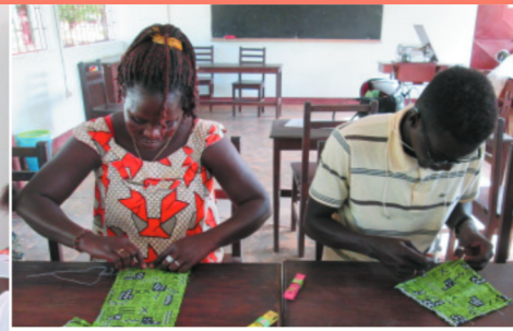
Taller formativo de corte y confección para jóvenes de ambos sexos