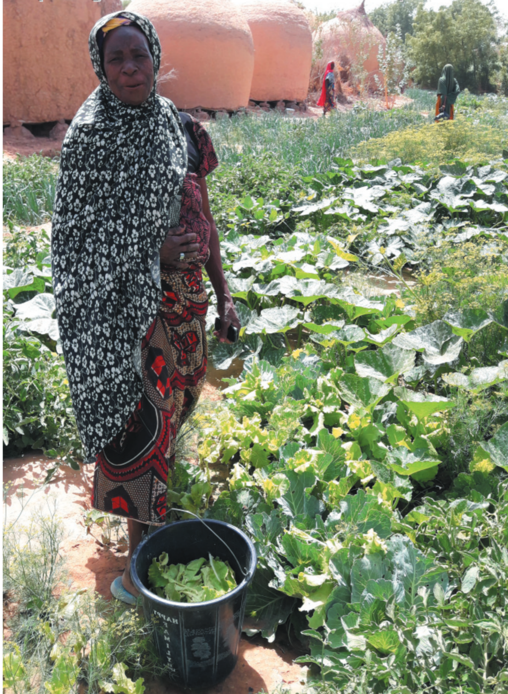
Imagen perteneciente al proyecto del MPDL en Níger, explicado en página 5