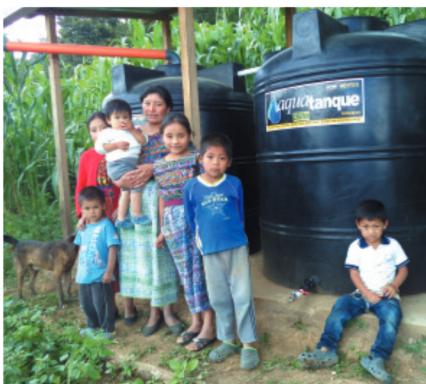
Familia beneficiaria con sistema de agua

El caserío de Tonajuyú, en el departamento guatemalteco de Chimaltenango, tiene una gran mayoría de población de la etnia maya