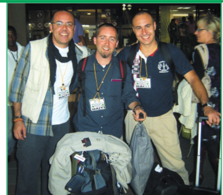
Los integrantes del equipo expedicionario, antes de su viaje

La Diputación de Sevilla ha editado este libro dada su vinculación con su contenido y con sus personajes, en particular, con el Departamento de Cooperación al Desarrollo y Ayuda Humanitaria.