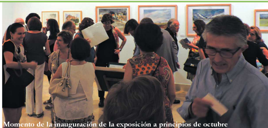
Momento de la inauguración de la exposición a principios de octubre

Hasta el próximo 25 de octubre, la Casa de la Provincia acoge la exposición solidaria Acuarelas para Laovo , una muestra de sesenta y cinco pinturas que ha sido posible gracias a la Asociación de Acuarelistas de Sevilla y Andalucía . Los autores, miembros de esta Asociación, han donado las obras para contribuir al sostenimiento del proyecto de desarrollo “Laovo Cande” promovido por Periodistas Solidarios