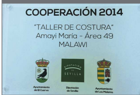
Los municipios de El Cuervo y Dos Hermanas desarrollaron conjuntamente en 2014 un Taller de costura en Malawi, con el apoyo de la Diputación de Sevilla