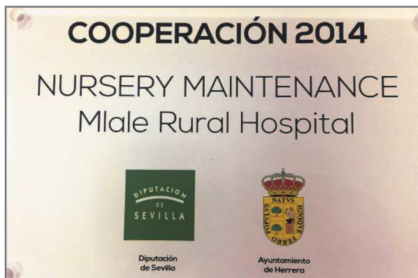
El municipio de Herrera desarrolló en 2014 un proyecto de Guardería en un Centro de salud en Malawi, con la colaboración de la Diputación de Sevilla

El Consejo Asesor constituido en julio aprobó una convocatoria extraordinaria, por que algunas entidades locales se “des-pistaron” en la presentación de la documentación necesaria por haber coincidido con época de campaña electoral y formación de equipos de Gobierno, dejándola incompleta o presentada fuera de plazo. Era la primera vez que ocurría que sobraba un montante no adjudicado y la decisión para aplicarlo fue aprobar esta segunda convocatoria extraordinaria.