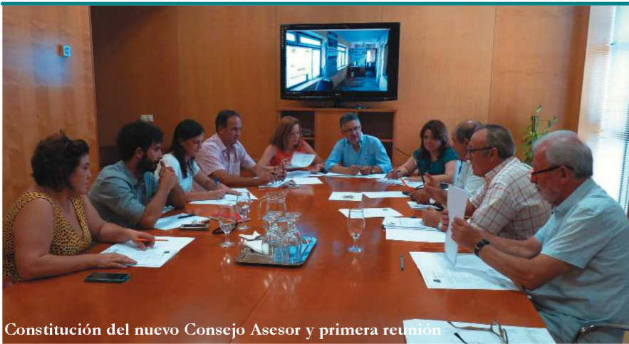
Constitución del nuevo Consejo Asesor y primera reunión

No lo dejemos en algo puntual y efímero. Ver es sentir, creer, actuar, comprometerse.