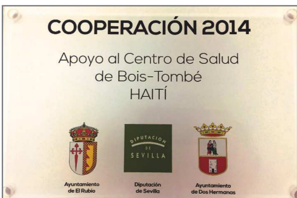
Los municipios de El Rubio y Dos Hermanas desarrollaron en 2014 un proyecto de apoyo a un Centro de salud en Haití, con la colaboración de la Diputación de Sevilla