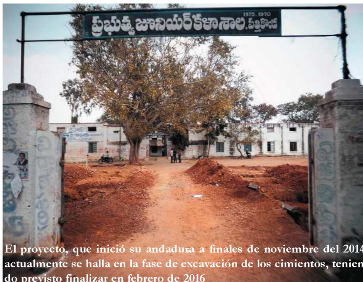
El proyecto, que inició su andadura a finales de noviembre del 2014, actualmente se halla en la fase de excavación de los cimientos, teniendo previsto finalizar en febrero de 2016

La Fundación Vicente Ferrer y su contraparte RDT/WDT están llevando a cabo el proyecto Mejora del acceso a una educación pública secundaria de calidad fomentando la equidad de género en el distrito de Kurnool, La India, con la colaboración de la Diputación de Sevilla.