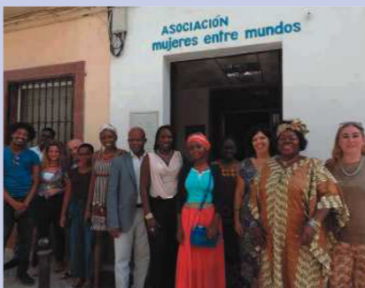
Algunas de las personas que participaron en la Jornada posan en la entrada a la Sede de la Asociación Mujeres entre Mundos, organizadora del evento

En África , a pesar de que debe afrontar aún muchos retos y desafíos, buena parte de sus países gozan ya de una economía y desarrollo emergentes con grandes posibilidades de progreso y grandes expectativas de futuro. En este sentido no hay que olvidar que nada de ello habría sido posible sin el coraje, trabajo y bondad que día a día demuestran las mujeres africanas, los verdaderos motores del cambio en el continente.