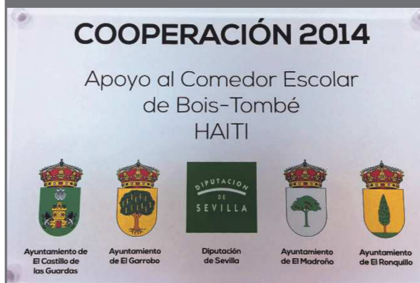
El Castillo de las Guardas, El Garrobo, El Madroño y El Ronquillo desarrollaron en 2014 un proyecto de apoyo a un Comedor Escolar en Haití, con la colaboración de la Diputación de Sevilla