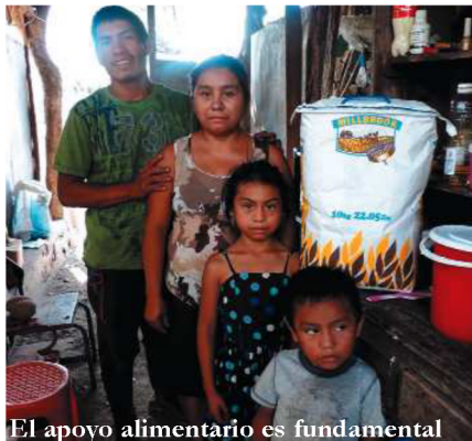
El apoyo alimentario es fundamental

La ONG Paz y Bien cuenta ya en Guatemala con una consolidada red de infraestructuras que le ha permitido entrar en contacto directo con una realidad de 14.440 casos de desnutrición grave y conocer la realidad de mujeres que necesitan condiciones de seguridad