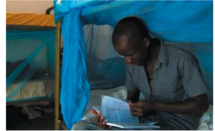
Un joven estudiante estudia sentado en su cama de la residencia masculina, recientemente ampliada y equipada

Nacuxa con la construcción de 6 nuevos cuartos para acoger a estudiantes masculinos y se equiparán con camas y literas, así como los ya existentes en la residencia femenina. También se prevé la redistribución del comedor aumentando el número de mesas para optimizar su uso, elevando el número de comensales hasta las 500 personas en cada tanda de comedor. El apoyo de la Diputación de Sevilla con el Instituto Agropecuario de Nacuxa se inició en 2005, cuando daba comienzo la experiencia de facilitar la FP a la población vulnerable del norte de