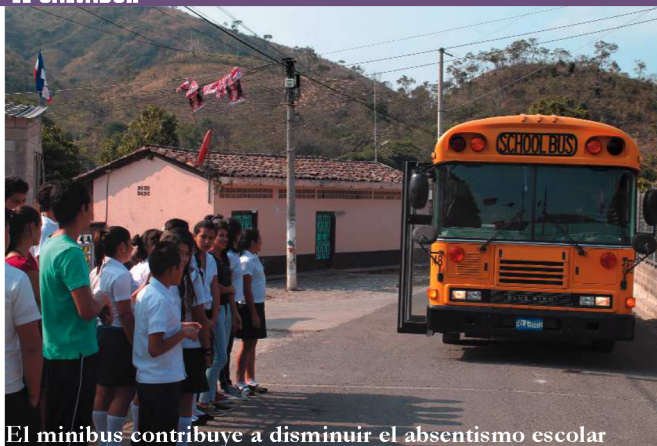
El minibus contribuye a disminuir el absentismo escolar