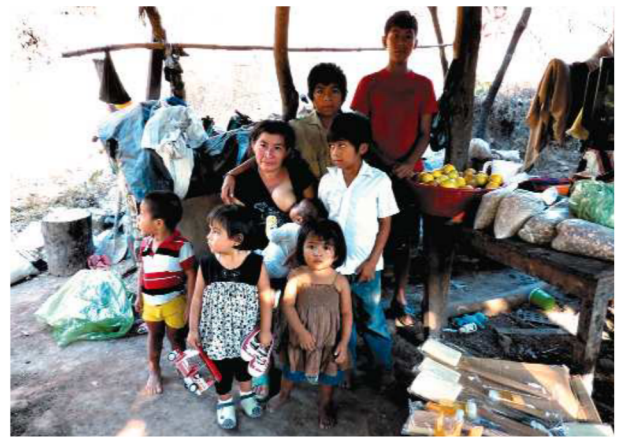
Las mujeres y sus hijos se incorporan directamente a los mecanismos de autogestión y empoderamiento

para el momento del parto o en situaciones de enfermedad de ellas o sus hijos, además de atenciones prestadas en régimen de acogida temporal. Por ello, ha iniciado, con el apoyo de la Diputación de Sevilla, el Programa de Acogida Materno-Infantil para Mujeres en Situación de Riesgo en el Corredor Seco , realizando una acción combinada de a) priorización de las beneficiarias entre las ya detectadas por acciones iniciales, gestantes o en post-parto o aquellas afectadas por enfermedad / maltrato y sus hijos y b) atención y seguimiento sociosanitario y psicosocial a estas mujeres, aportándoles cuanto les sea necesario para superar