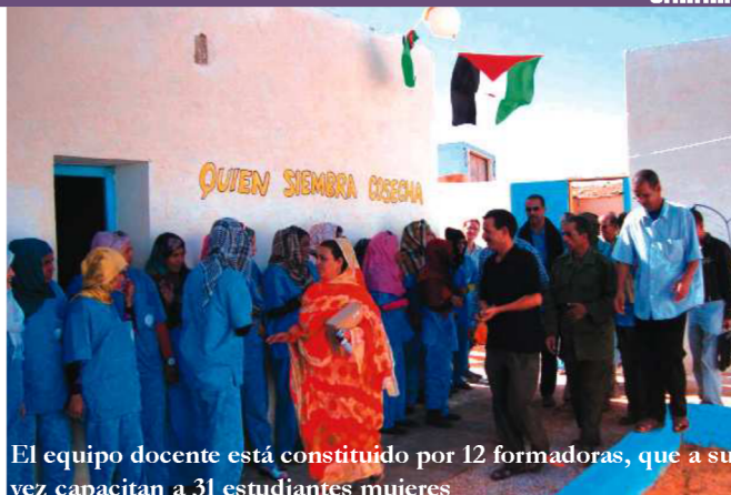
El equipo docente está constituido por 12 formadoras, que a su vez capacitan a 31 estudiantes mujeres

Las Vueltas es un pequeño municipio de El Salvador en el que viven muchos campesinos dentro de pequeños núcleos, algunos a 1 km y otros entre 8 y 10 km retirados de la escuela, que está ubicada en el centro del pueblo. Cada mañana, los niños y niñas tienen que recorrer un largo y dificultoso camino para asistir al colegio, lo que produce un alto absentismo escolar y un bajo rendimiento. Además, hay incidentes con las niñas más mayores. Ante la solicitud de ayuda de la alcaldesa a la Diputación de Sevilla para comprar un microbús escolar de segunda mano, el año pasado se aprobó en Consejo Asesor de Cooperación la compra del vehículo y en Las Vueltas ya cuentan con tan preciado medio de transporte escolar.