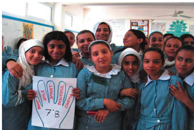
El efecto positivo se refleja de inmediato en las expresiones de las niñas

En este tremendo contexto, este proyecto tiene como objetivo la mejora de la educación en Gaza de manera que el profesorado y la escuela sean recursos para el adecuado desarrollo psicológico de los niños y niñas de Gaza, desde una mirada centrada en el buen trato, lo positivo y la necesidad de crear contextos apropiados para la infancia. Es así como Golden5 , con el apoyo de la Diputación de Sevilla, puso en marcha la visita de las coordinadoras del programa Golden, que era y es esperada en la zona para dar cursos de formación, visitar escuelas y apoyar el seguimiento