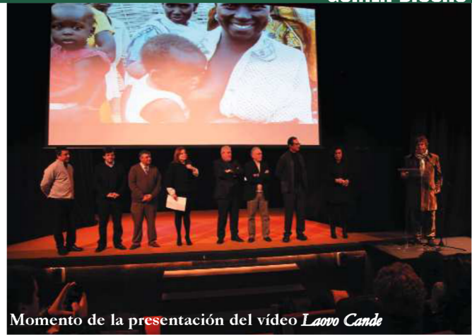
Momento de la presentación del vídeo Laovo Candé

Canal Sur TV y la Asociación de la Prensa de Sevilla (APS) han presentado el vídeo Laovo Candé , sobre un proyecto de Periodistas Solidarios , agrupación de la APS, en Guinea Bissau, financiado por la Diputación de Sevilla y los municipios Cañada del Rosal y Fuentes de Andalucía . El proyecto incluye la creación en la aldea de Candemba-Uri, de una escuela para 60 niños y niñas de 3 a 6 años, una cooperativa de campesinas, una emisora de radio de mujeres y un centro de salud. La escuela y la cooperativa están funcionando desde el 6 de enero y este año se quiere continuar con el arranque de la radio, en colaboración con Canal Sur y RNE, además de la construcción del centro de salud y la dotación de agua potable