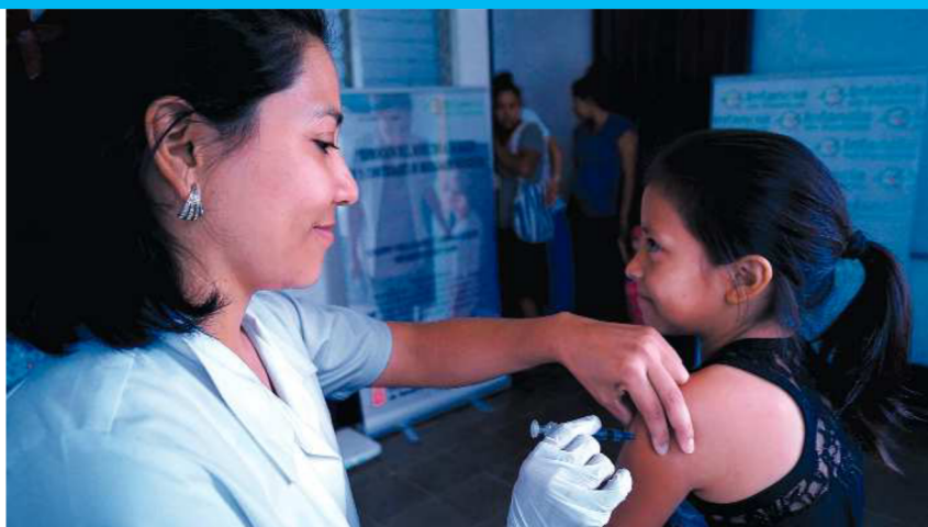
Uno de los pilares fundamentales del proyecto es la vacunación