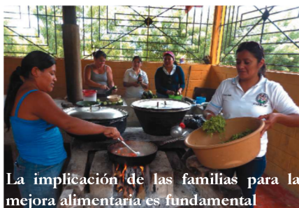
La implicación de las familias para la mejora alimentaria es fundamental

Para contribuir a la seguridad alimentaria y a la reducción de la desnutrición infantil de niños y niñas Maya Q'eqchí del sur de Petén, Global Humanitaria ha puesto en marcha con el apoyo de la Diputación de Sevilla, un proyecto denominado MAYA-SAN :