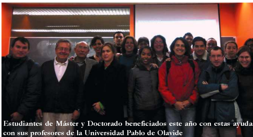
Estudiantes de Máster y Doctorado beneficiados este año con estas ayudas con sus profesores de la Universidad Pablo de Olavide

L a Universidad Pablo de Olavide , con el apoyo de la Diputación de Sevilla, actúa directamente sobre el bienestar y desarrollo de las sociedades latinoamericanas mediante ayudas a estudiantes de los diferentes países para realizar su investigación en las bibliotecas y archivos de la ciudad hispalense. El efecto de estas ayudas, sin las cuales los estudiantes no podrían realizar sus estudios en Europa, es indudablemente positivo: fomentan el desarrollo de las sociedades latinoamericanas y africanas formando estudiantes y doctorándolos para que éstos contribuyan al desarrollo humano de sus sociedades locales. El alumnado que se acoge a la ayuda proviene de Bolivia, Colombia, Ecuador, Guatemala, Perú, Gabón, República Dominicana, México y Venezuela, entre otros, siendo seleccionados a menudo por sus comunidades indígenas de origen, instituciones universitarias públicas o por