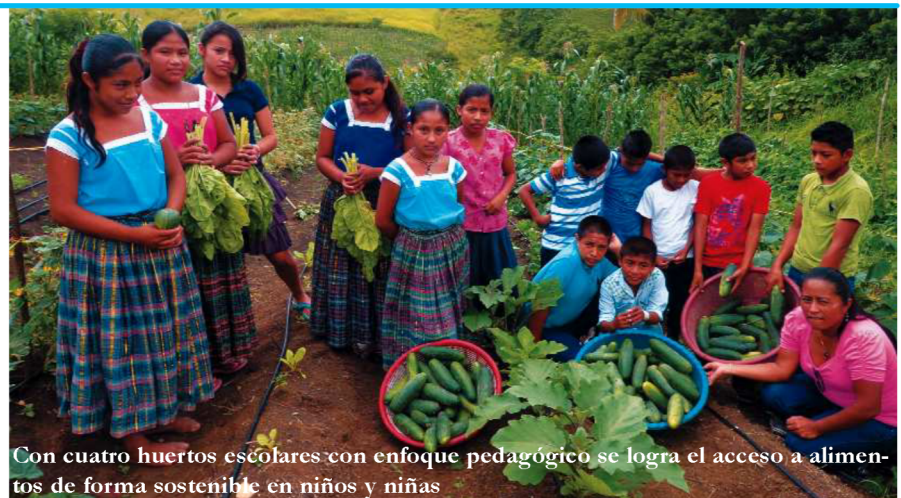
Con cuatro huertos escolares con enfoque pedagógico se logra el acceso a alimentos de forma sostenible en niños y niñas

Niños y Niñas Maya Q'eqchi mejorando su estado nutricional presente y futuro con "Comedores y Huertos escolares", en cuatro comunidades indígenas del sur del Departamento de Petén (Municipios de Poptún y San Luis).