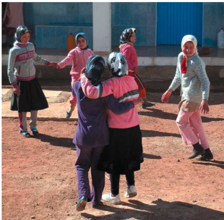
Se ha alfabetizado a 100 mujeres de la Comuna Rural de Agla, con un total de 300 horas de alfabetización