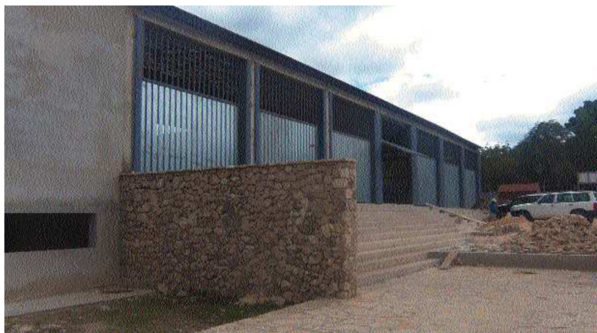
Exterior de las nuevas instalaciones del mercado y centro cívico en Fond-des-Blancs

La Corporación provincial avanza en los trabajos de construcción de infraestructuras sociales y mantiene su apoyo a las expediciones de médicos del Hospital de Valme