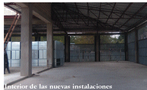
Interior de las nuevas instalaciones

El proyecto se encuentra ejecutado al 75%, a falta de la instalación del sistema de alimentación de energía eléctrica, que será obtendrá de forma limpia con energía renovable, y los acabados finales que permitirán el disfrute para usos múltiples de un edificio sin igual en toda la zona.