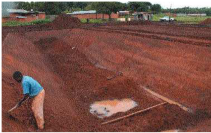
Construcción de la balsa para criar peces

Hace años que la ONG Andalucía por un Mundo Nuevo desarrolla diversos proyectos en Mlale (Malawi) para fomentar el desarrollo agropecuario, la mejora de la calidad alimentaria y el acceso al agua sana, con el apoyo del