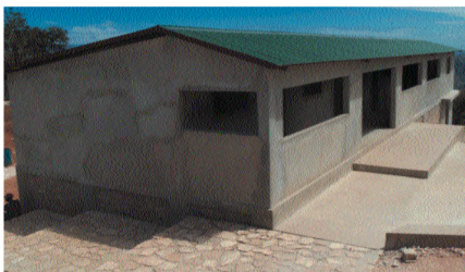
Nuevas aulas escolares en Bois Tombé

construida en la zona donde educativo, el centro médico recién finalizados en Bois Tombé