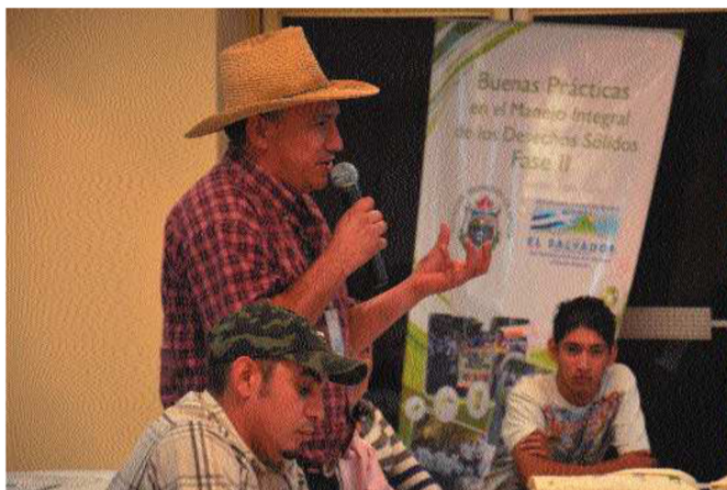
El Alcalde de uno de los Municipios, durante su intervención en uno de los talleres celebrados el segundo día del Encuentro

En enero ha tenido lugar un importante evento en El Salvador, un país que, al igual que otros países de Latinoamérica se encuentra inmerso en procesos que mejoren y desarrollen el sistema de Estado descentralizado. Se trata del Encuentro Nacional La gestión pública local de servicios, que ha organizado la Alcaldía de Apopa, la Agencia Española de Cooperación Internacional para el Desarrollo (AECID), la Subsecretaría de Desarrollo Territorial y Descentralización del gobierno salvadoreño y el FAMSI.