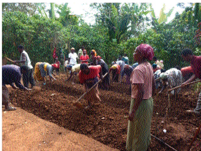
Al menos el 75% del alumnado hace prácticas sobre agricultura en terrenos del centro materno-infantil de Mizan Teferi

E l proyecto de Nuevos Caminos en Etiopía consiste en un programa de mejora de la producción de alimentos, en el centro materno-infantil localizado en Mizan Teferi y en la aldea de Gacheb (situada a 3 km). Por tanto, con el apoyo de la Corporación Provincial se desarrolla el objetivo general de mejorar el estado nutricional de los 120 niños y niñas de edades comprendida entre cuatro y seis años que lo visitan diariamente, a los que se les proporciona un desayuno y una comida diaria rica en proteínas y vitaminas, así como educación preescolar. Igualmente se busca el aumento de los conocimientos de las mujeres de Mizan Teferi y de los padres y madres de Gacheb, a través de cursos de educación nutricional y su capacitación en producción alimentaria. Así, 30 mujeres de Mizan Teferi y 25 madres y padres de Gacheb realizan el cultivo de la tierra del centro sanitario con hortalizas y árboles frutales y son formados sobre la preparación de alimentos.