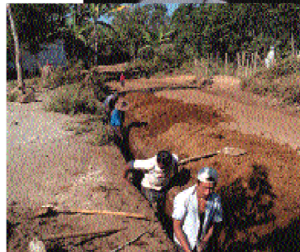
Construcción de los sistemas de canalización de aguas por integrantes de la comunidad beneficiaria

Con todo este trabajo se logra reducir la vulnerabilidad de la comunidad ante posibles desastres, elevando de forma sostenible la calidad de vida de sus integrantes.